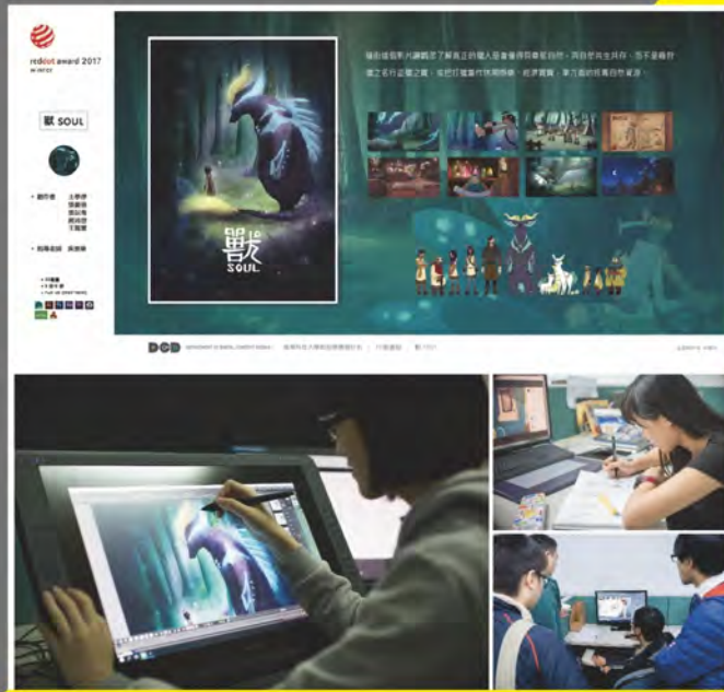
德國紅點設計獎得獎作品