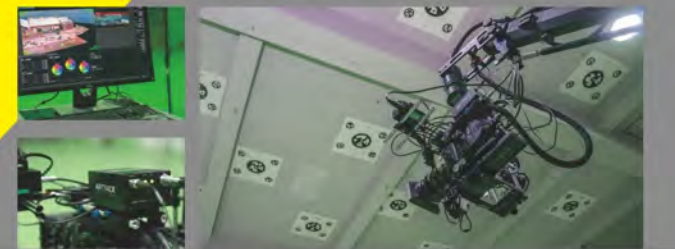
光學追蹤系統、電影高速攝影機、電動遙控機器手臂系統