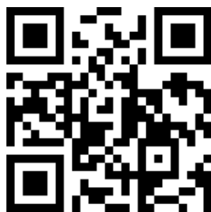
物聯網應用報名 QR code