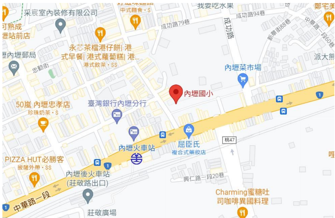
▲ 桃園市內壢國小-地理位置圖