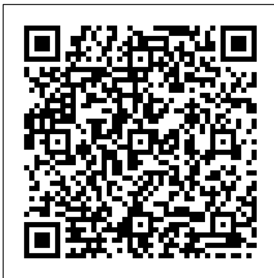
( 臺北市政府教育局親子綁定及校園繳費專區 QR CODE )