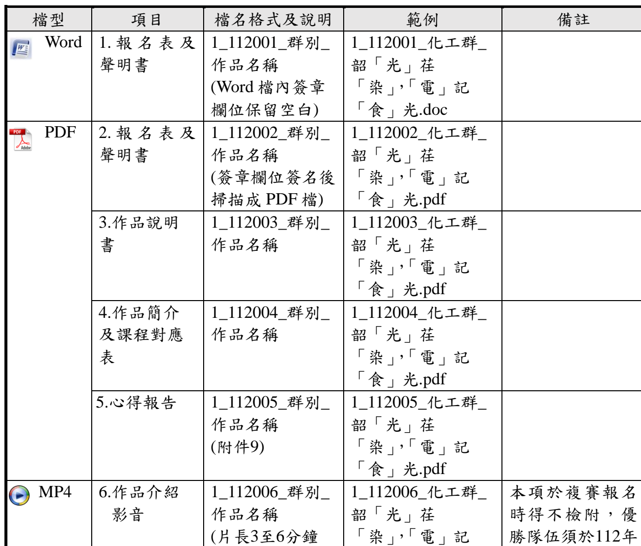
表1-2 專題組電子檔光碟範例說明