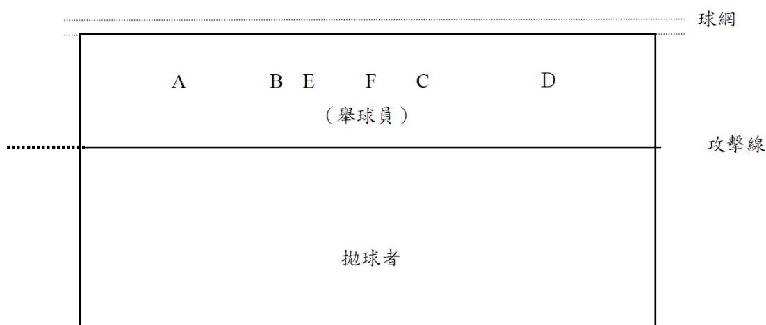
圖二 排球攻擊手快攻位置示意圖

(1) 拋球者（由本校考試委員安排）將球拋給 F 點之考生（舉球員），考生（快攻手）分別依 A、B、C、D 等不同位置進行快攻（如圖二），球網對面則由考生（自由球員）進行防守。各位置之操作步驟如下。