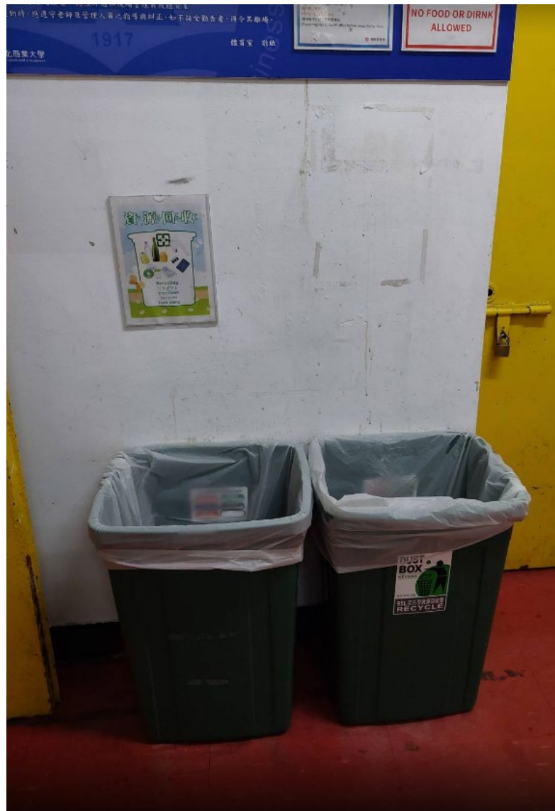
國立臺北商業大學