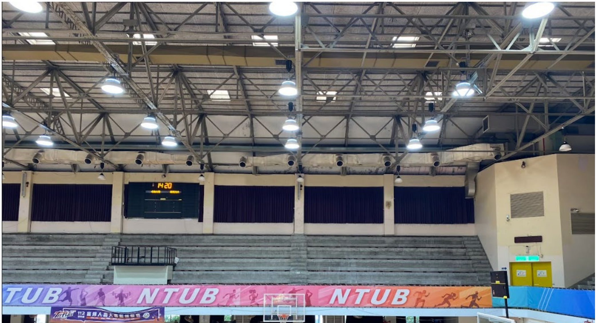
國立臺北商業大學