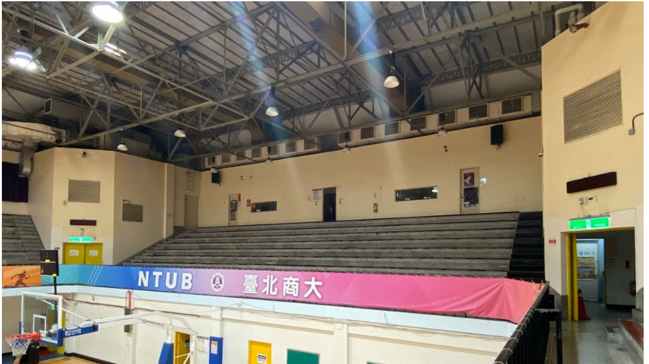
國立臺北商業大學