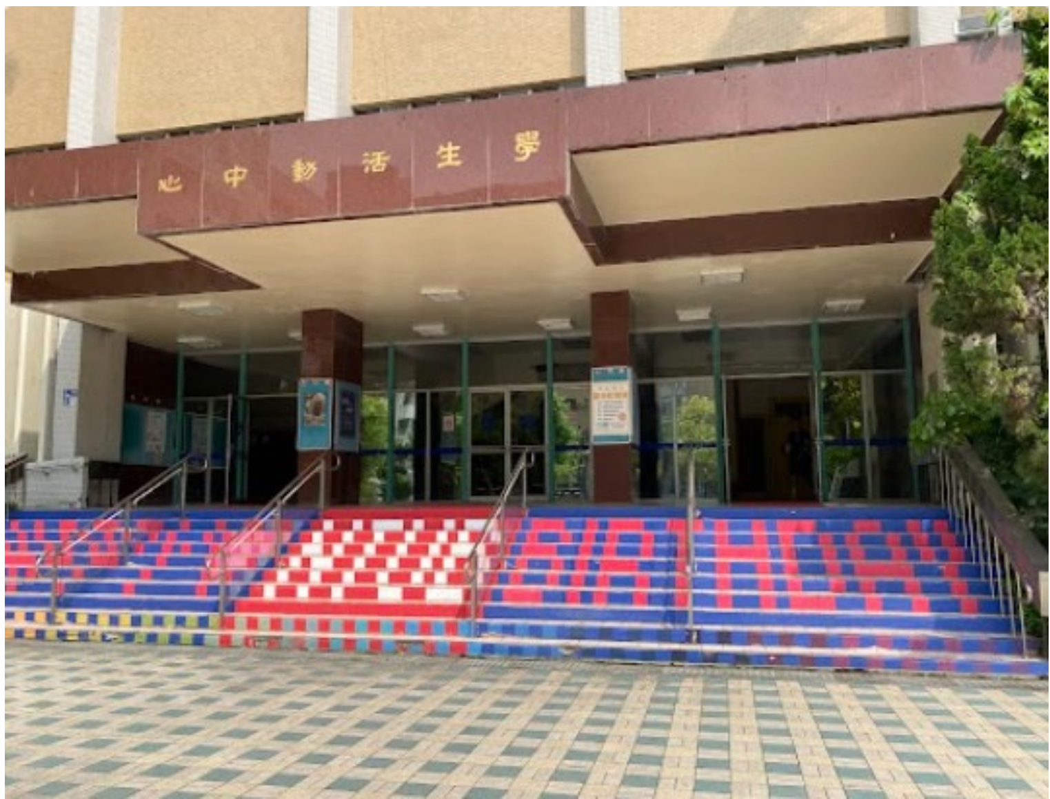
國立臺北商業大學