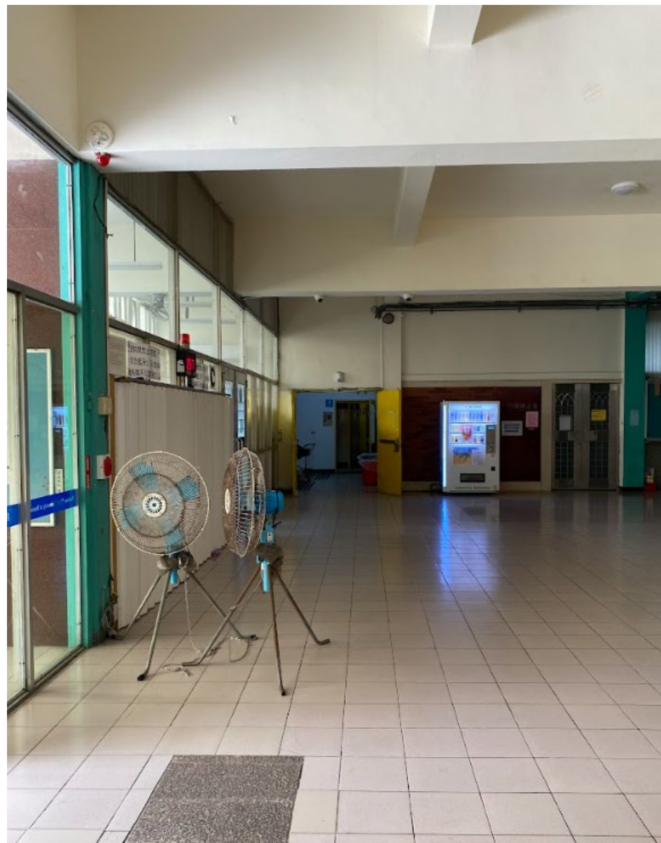
國立臺北商業大學