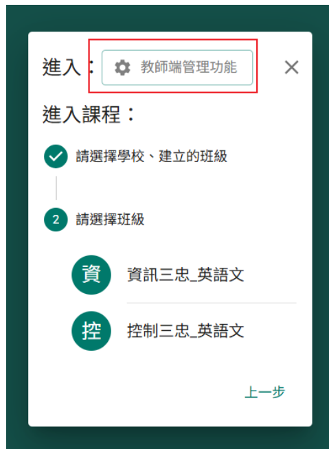
圖 2：點選「教師端管理功能」並選擇班級或課程

操作： 在課堂工具的進入課程視窗中，點選上方齒輪圖示「教師端管理功能」。接著依畫面選擇學校與要查看的班級或課程。