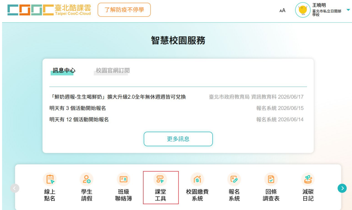
圖 1：在酷課雲首頁點選「課堂工具」